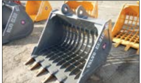
Selection of New and Used Buckets