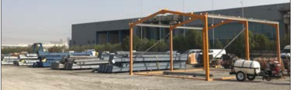
Choice of Steel frame Buildings - UK Manufacturers from UK steel Sizes 200ft x 60ft x 19ft 6in to 60ft x 30ft x 16ft