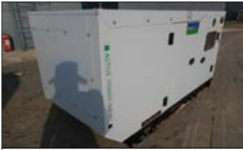
Unused Aska AS100 100KVA