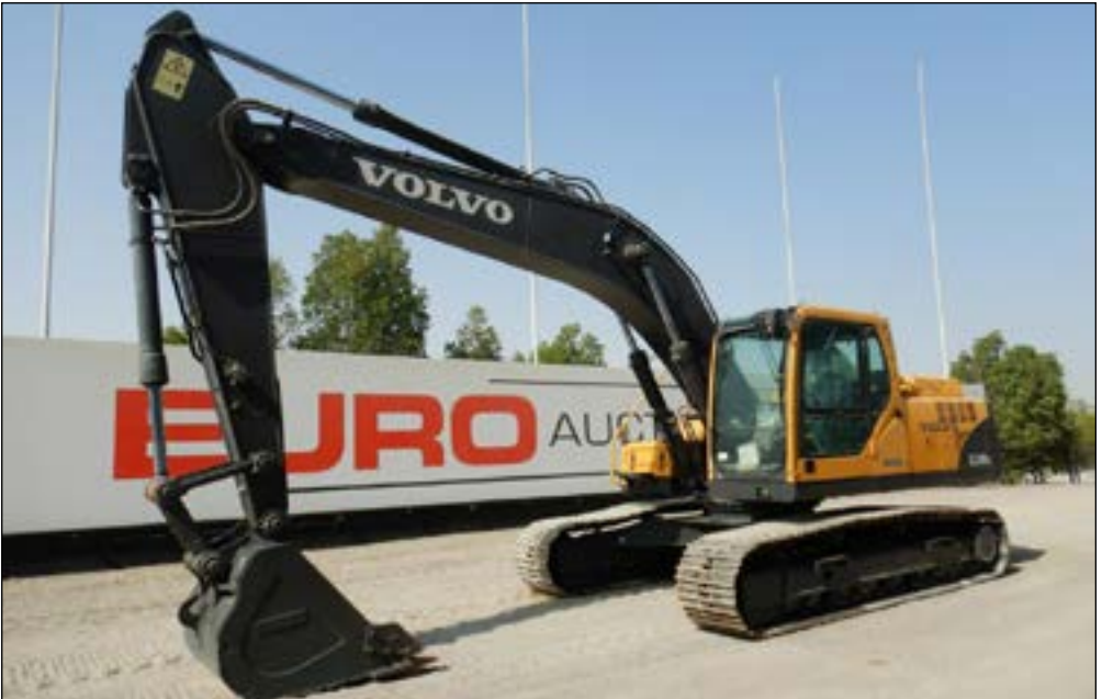
Unused Volvo EC210BLC - choice