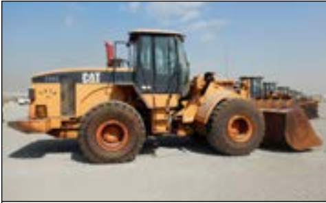
2006 CAT 966G II - choice