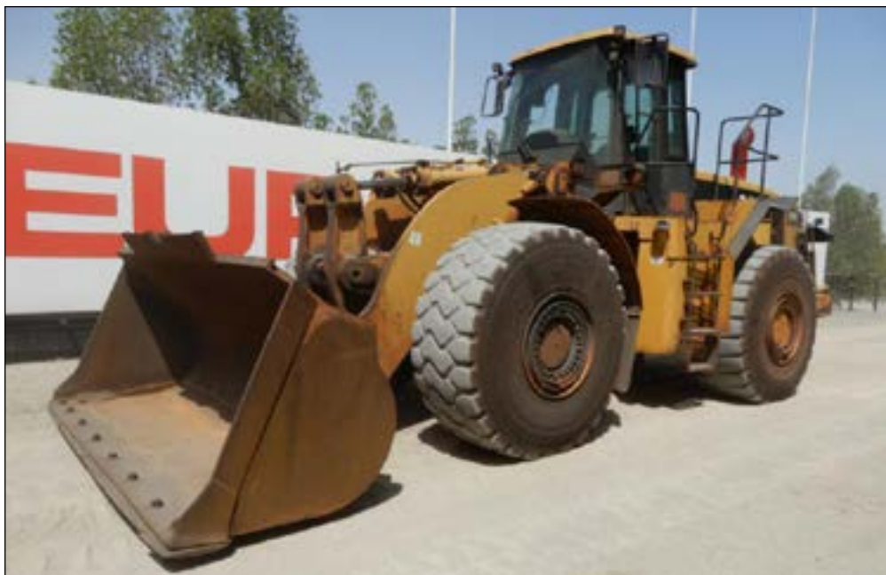
2006 CAT 980G II - choice