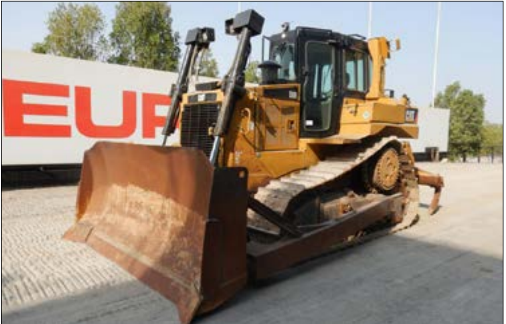
2013 CAT D6R