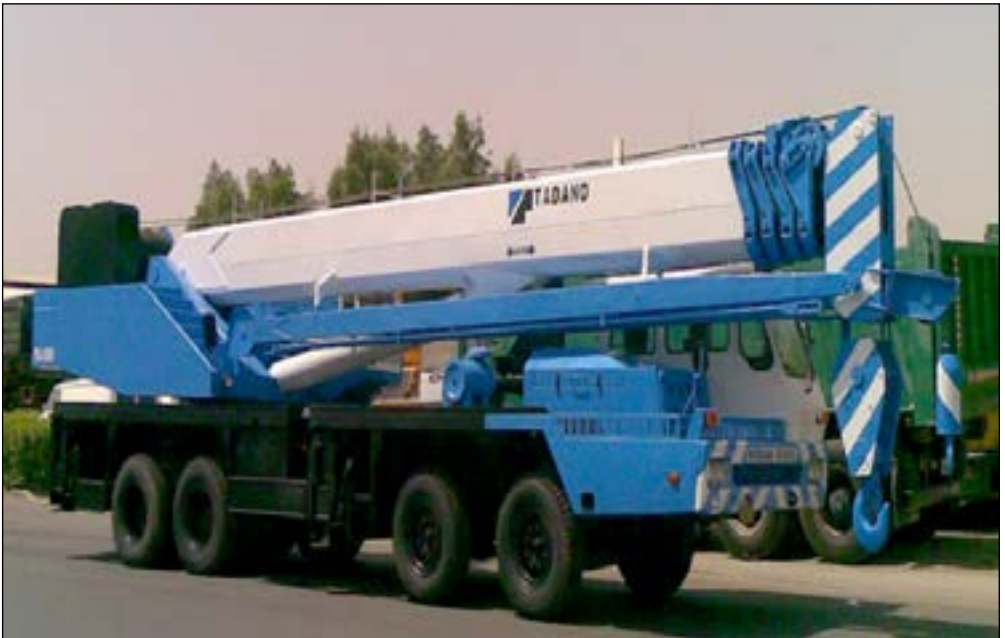
1997 Tadano TG500 8x4 Truck Mounted Crane