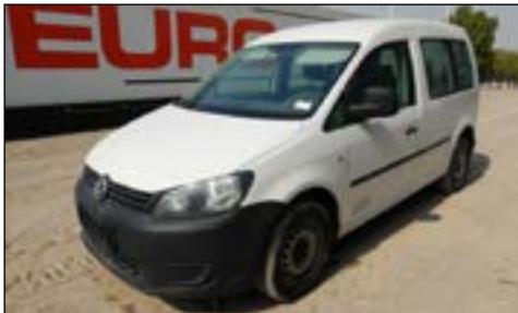
2013 Volkswagen Caddy