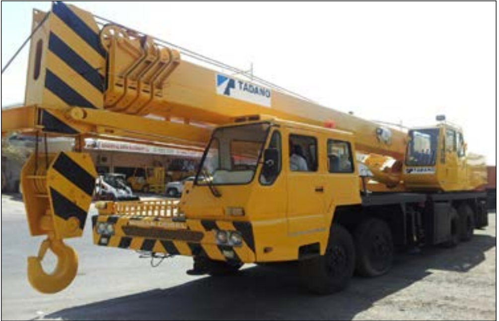
1998 Tadano TG550E 8x4 Truck Mounted Crane