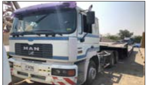
1999 MAN 27.464 6x4