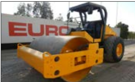
2006 Bomag BW212D