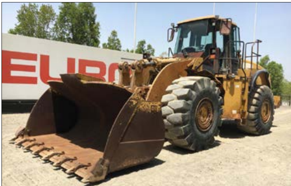
2007 CAT 980H