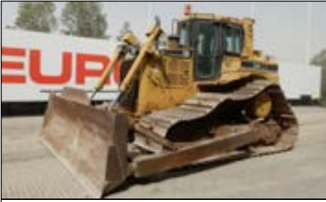
2007 CAT D6R LGP-III - choice