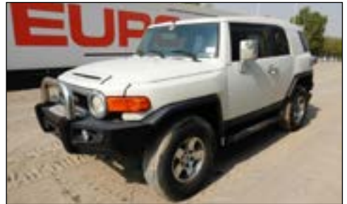
2009 Toyota FJ Cruiser