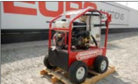
Unused Pressure Washer - choice