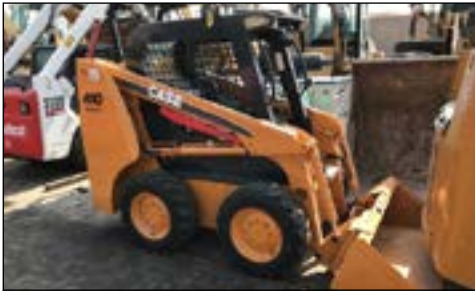
08-11 Case 410 - choice