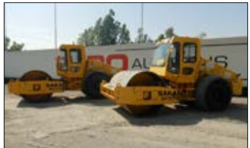
Sakai Single Drum Vibrating Roller - choice