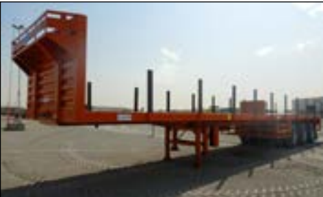
Unused Al Shahina Tri Axle Flatbed Trailer (15mx2.5m)