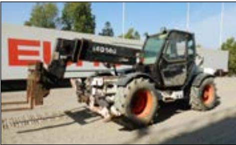
2006 Bobcat T40140