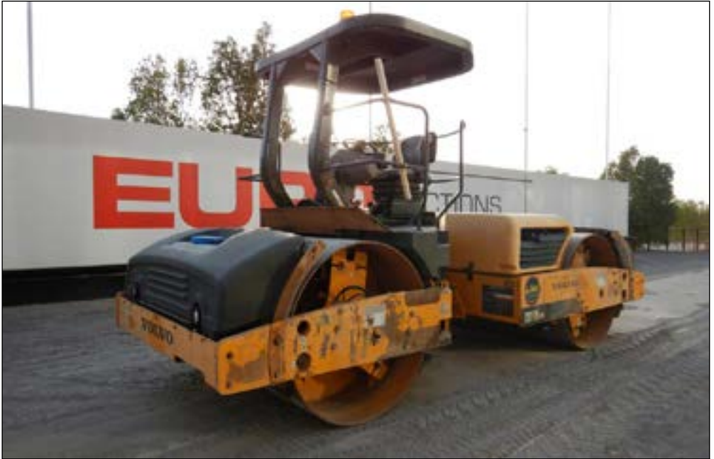
2011 Volvo DD138HFA