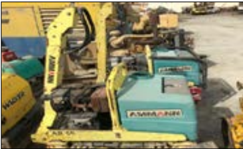
03-05 Ammann AR65 - choice