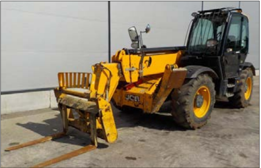
2013 JCB 535-140