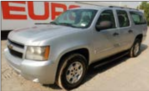
2011 Chevrolet Suburban