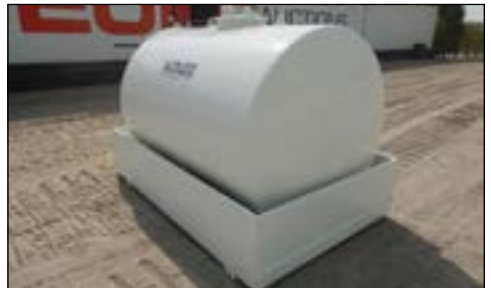
Unused Emiliana Serbatoi TF-3/50 3000 Litre Fuel Tank - choice