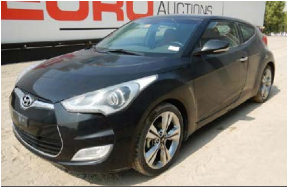
2016 Hyundai Veloster