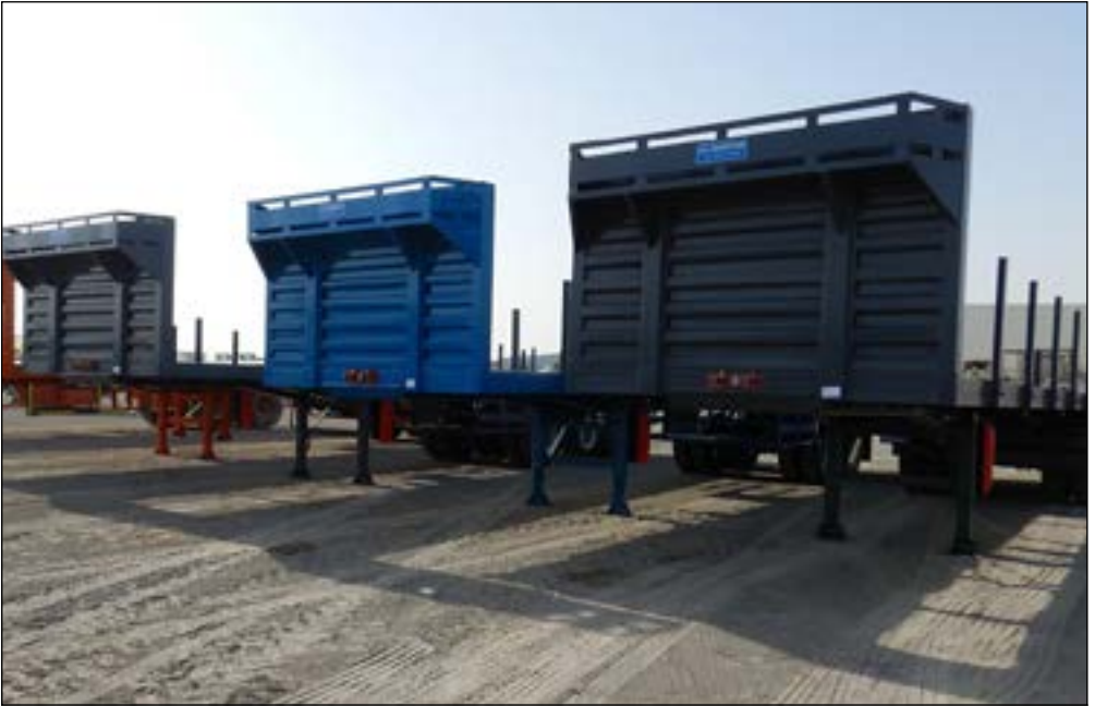
Unused Al Shahina Tri Axle Flatbed Trailer (12mx2.5m) - choice