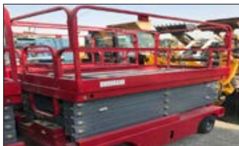
Unused ZoomLift X9000 - choice