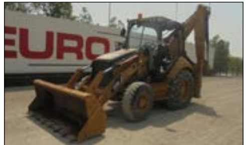
2008 CAT 428E