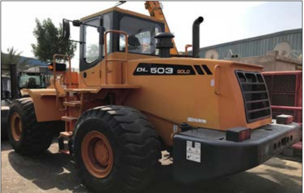
2015 Doosan DL503 GOLD