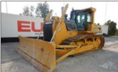
2008 Komatsu D85EX-15R