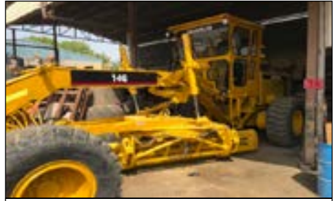
CAT 14G - choice