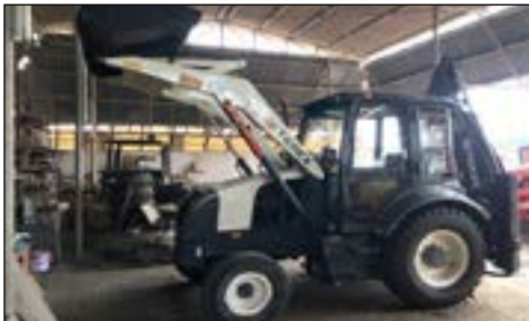
2012 Terex TLB844S