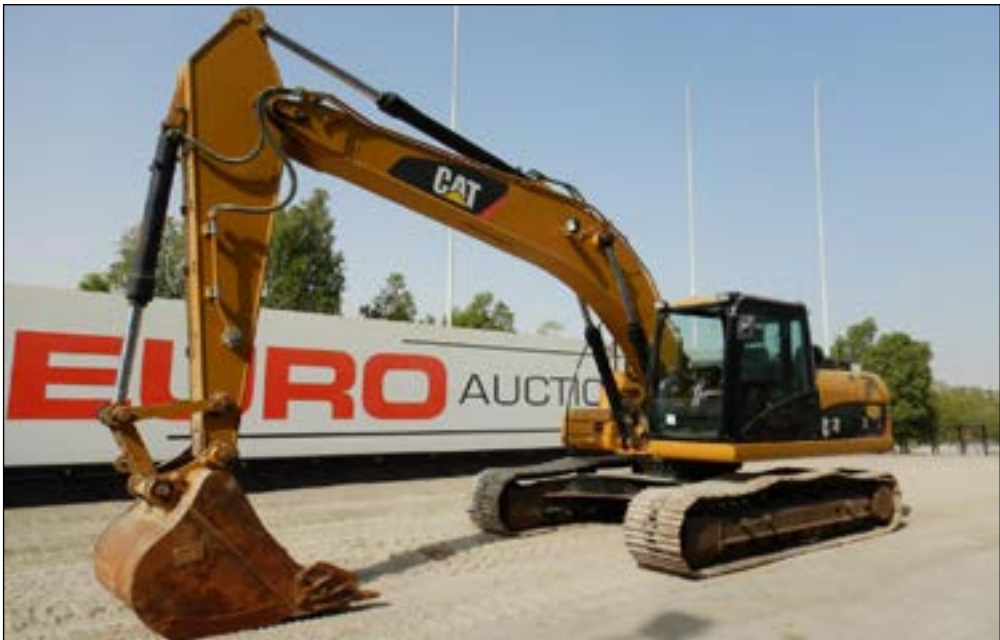
2013 CAT 320DL