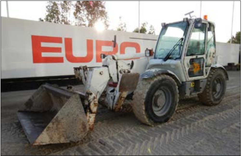
07-08 JCB 535-125 - choice