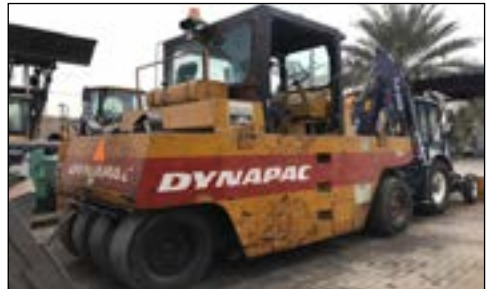
Dynapac CP27 Penumatic