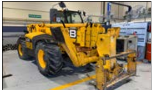
2008 JCB 540-170 - choice