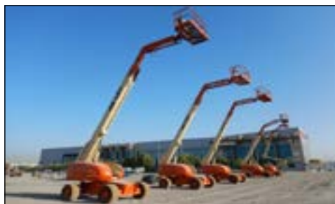
JLG 660SJ, 600SJ & 450AJ