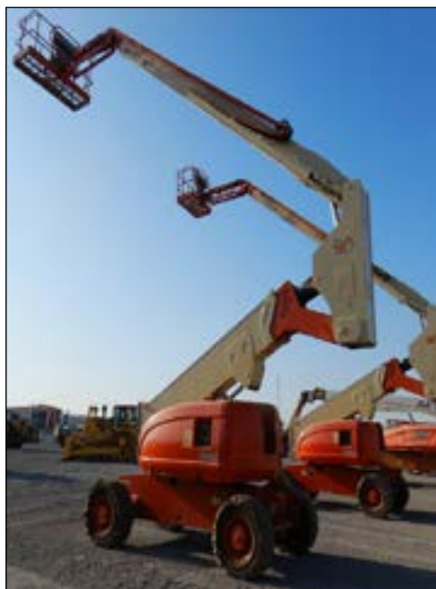
JLG 800AJ - choice