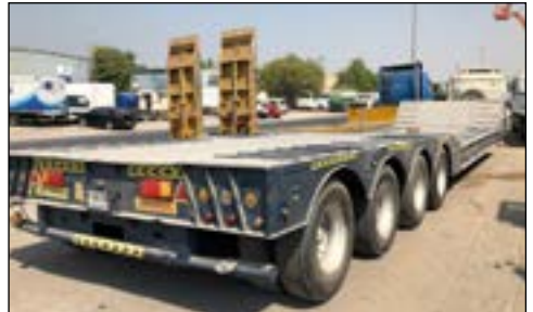
2009 Al Jaber 4 Axle 100T Front Loading Low Bed