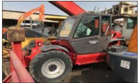
2005 Manitou MT1740SLT