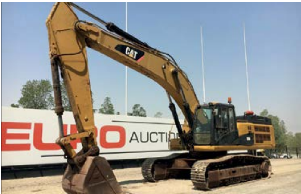
2010 CAT 345D - choice