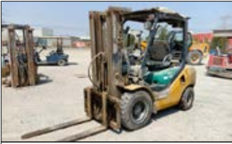
2007 Komatsu FD30T-16