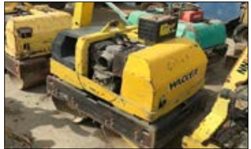
07-10 Wacker Neuson RD7H-S - choice