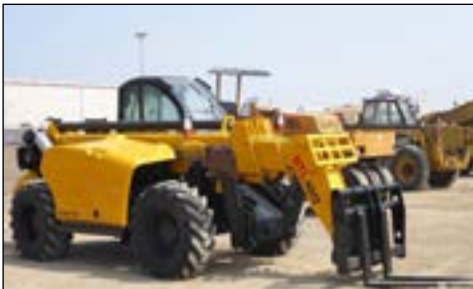
2007 Haulotte HTL4017