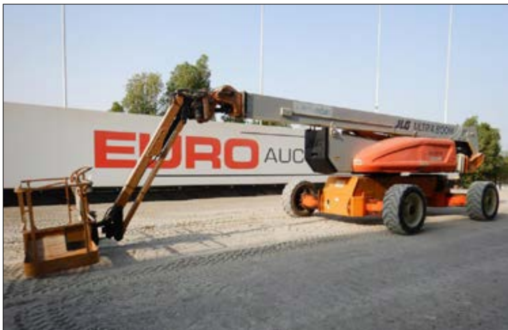
2012 JLG 1250AJP - choice