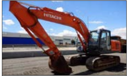
2009 Hitachi ZX200-3