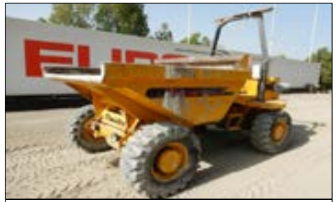
2008 Thwaites 5 Ton