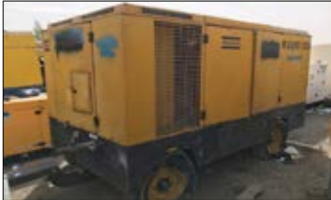
Atlas Copco XAMS 850