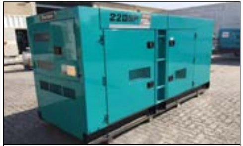
2014 Denyo DCA220SPK 200KVA