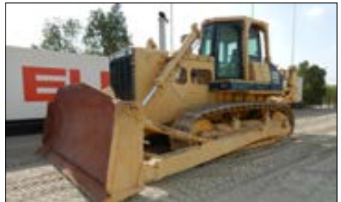
2008 Komatsu D155A-2