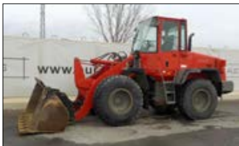
2006 Komatsu WA150PZ-5