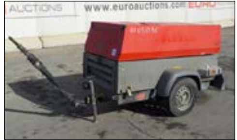
2011 Atlas Copco XAS87KD 176CFM