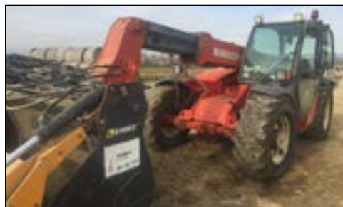
2003 Manitou MLT730