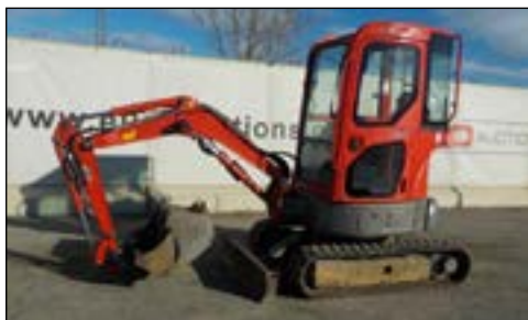
2007 Komatsu FC20MR-2