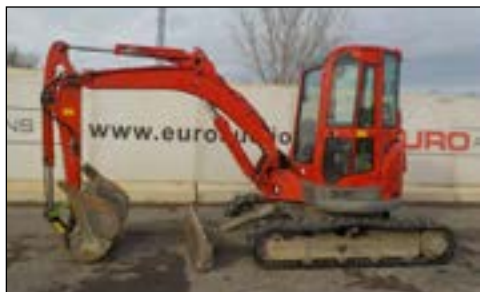
2011 Yanmar VI050 UCR