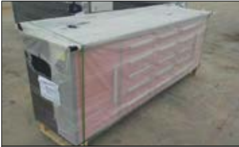
No Usado 10" Work Bench - selección