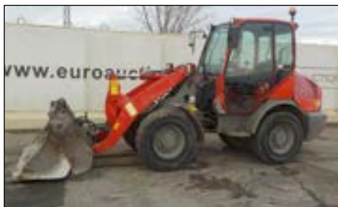
2006 Komatsu WA70-5