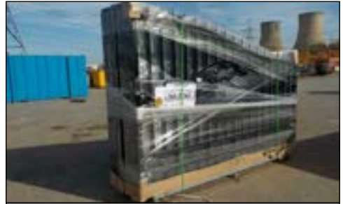
No Usado 20" Wrought Iron Gates - selección