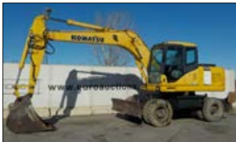
2004 Komatsu PW160ES-7K