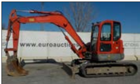
2010 Volvo ECR88