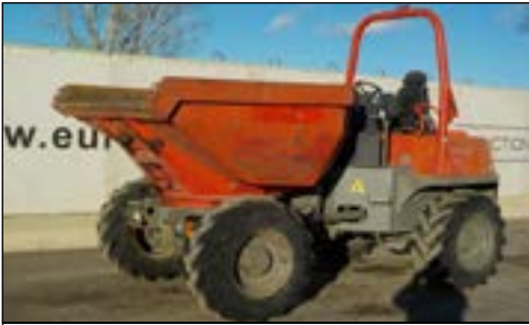
2010 Ausa D600 APG