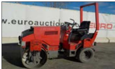
2005 Hamm HD12K