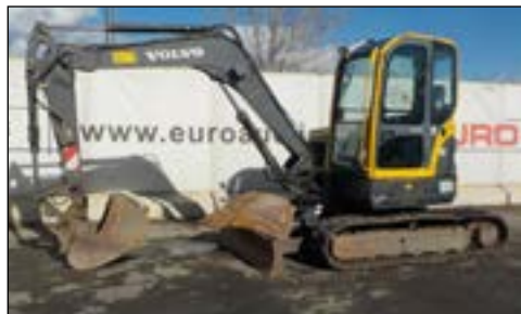
2005 Volvo ECR58