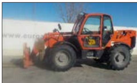
2005 JCB 535-125