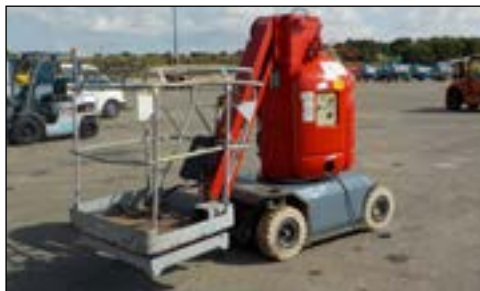
2005 Manitou 105VJR-2