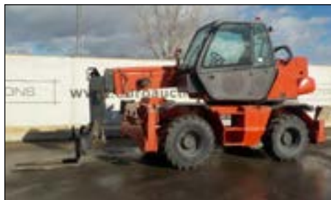
2007 Manitou 1432MRT