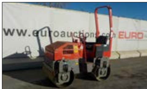
2007 Bomag BW100ADM