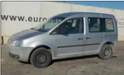
2004 Volkswagen Caddy 1.9TDI