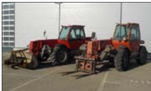
06-07 Manitou MT1235 - selección