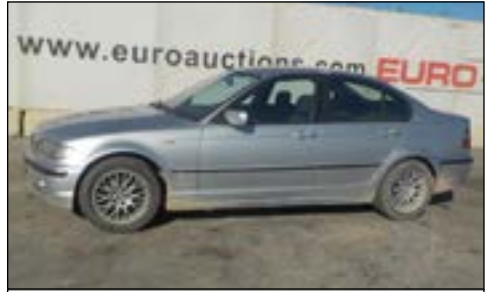
2002 BMW 320D