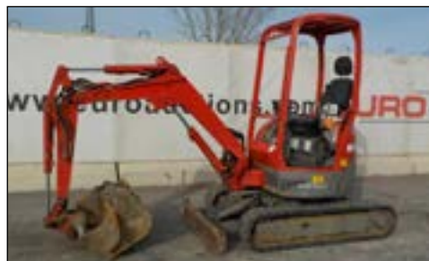
2006 Yanmar VI020