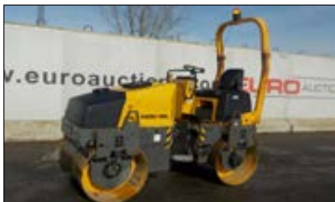
2005 Ammann AV26E