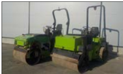
Wacker RD25 - selección