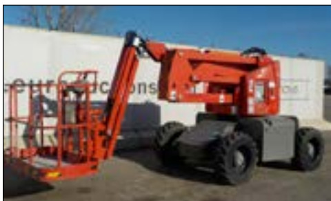
2008 Haulotte HA120PX