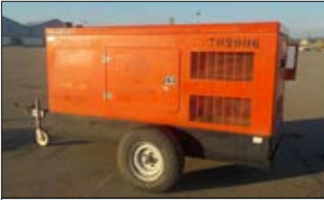
2007 Himoinsa HFW100-T5