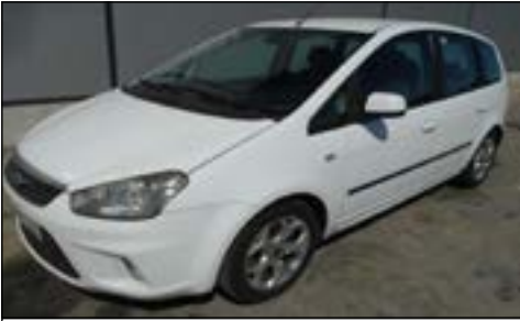
2009 Ford C-MAX 1.6TDCI