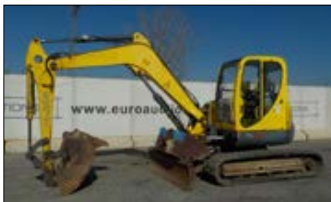
2008 Neuson 75Z3RD