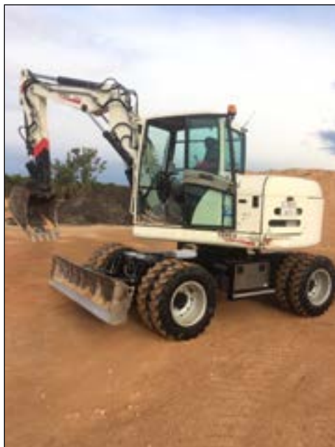
2005 Terex HML42