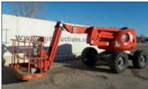
2010 Haulotte HA16PX