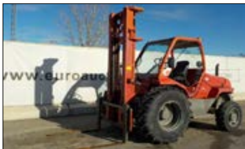
2001 Manitou M26-4