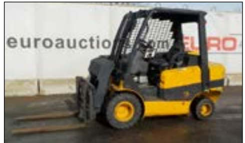
2001 JCB TLT30D