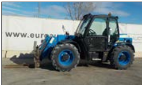
2008 JCB 531-70