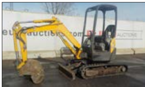
2011 Yanmar VI025-4