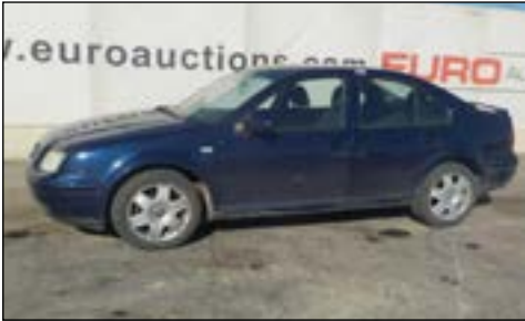
2001 Volkswagen Bora 1.9TDi