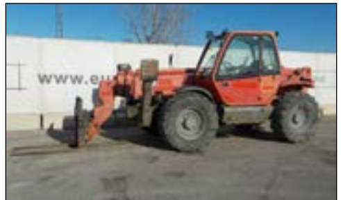
2007 Manitou MT1740