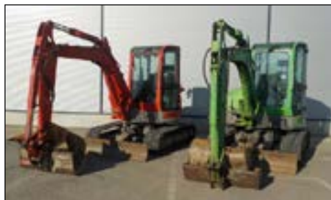
10-11 Yanmar VI050-U - selección