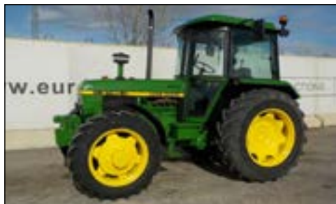
John Deere 2140