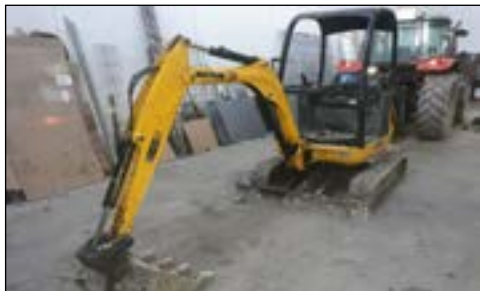
2015 JCB JS8018