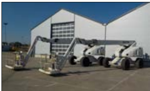
2005 Haulotte H23TPX - selección