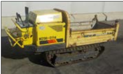
2006 Yanmar C6R