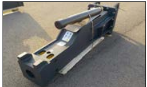
Selección de Martillos Nuevos