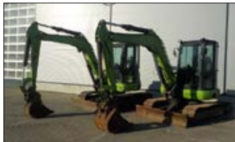
2007 Eurocomach ES500ZT - selección