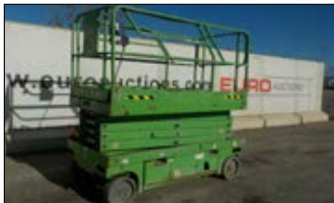
2007 Haulotte Compact 12