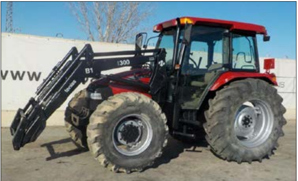
2004 Case JS 100U