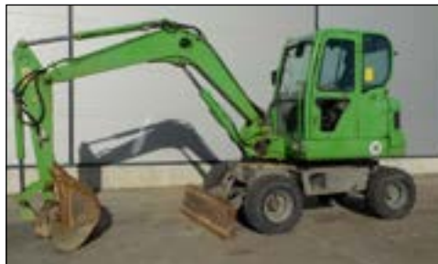
2010 Yanmar B55W-2