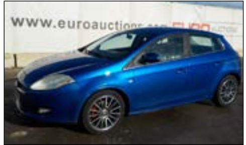
Fiat Bravo 1.9 Sport 150CV