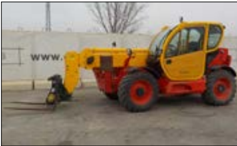
2011 Dieci 175