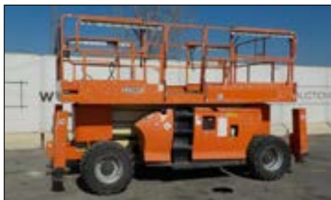
2007 JLG 3394RT