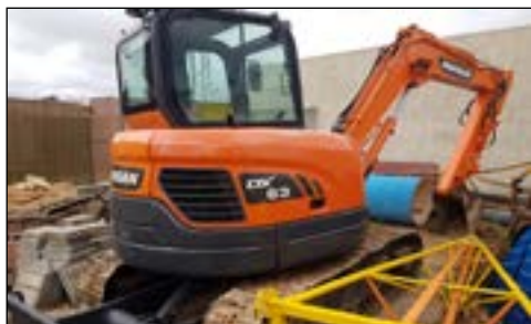
2015 Doosan DX63-3