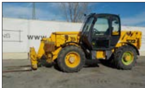
2001 JCB 532-120