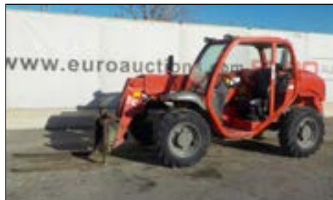
2006 Manitou MT523