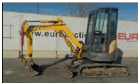
2010 Yanmar VI025-3