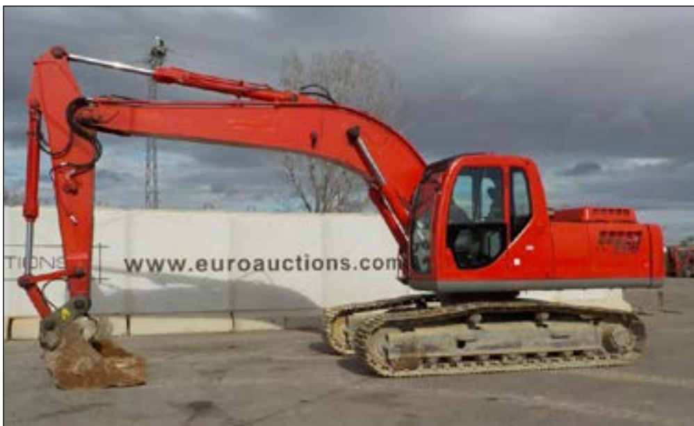
2006 New Holland Kobelco E215