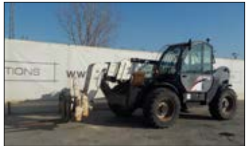
2008 Terex 4017