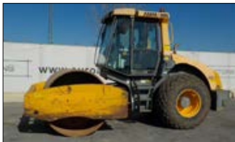
2005 Ammann ASC150