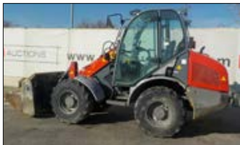
2011 Kramer Allrad 346