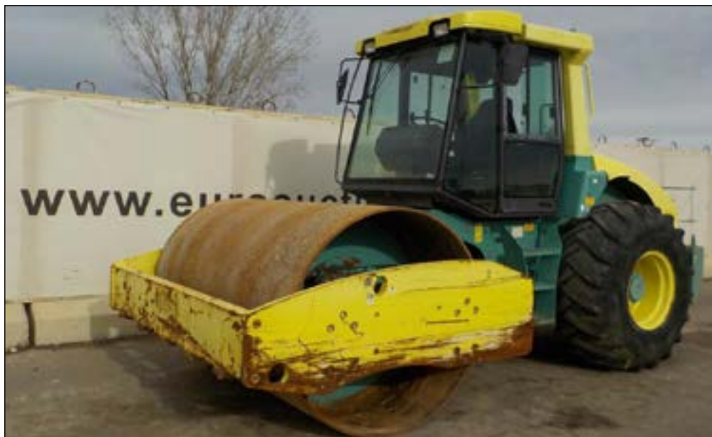
2009 Ammann ASC110PD