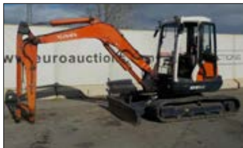
2007 Kubota KX161-3A