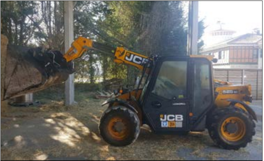
2015 JCB 525-60 (1,489 hours)