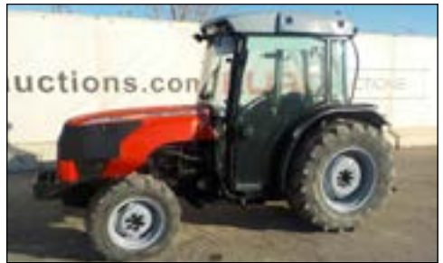
2002 Massey Ferguson 3340F