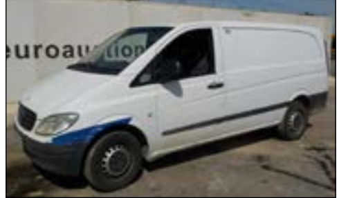
2006 Mercedes Vito 111 CDI