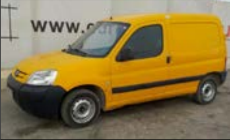
2007 Peugeot Partner