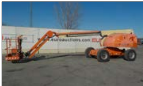
2006 JLG 460 SJ