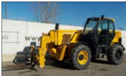
2007 JCB 540-170