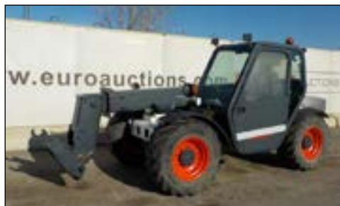
2002 Bobcat T2566