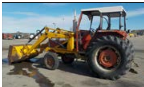
Massey Ferguson 297