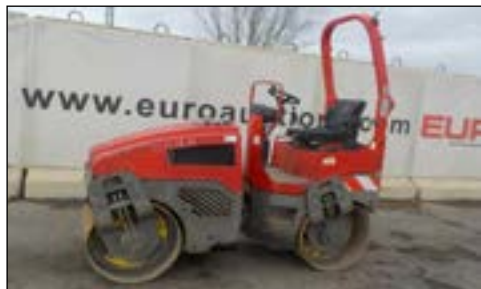
2000 Bomag PV3-2