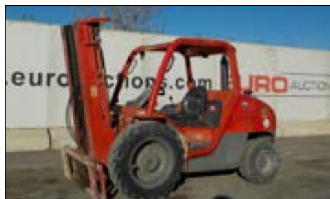
2007 Manitou MH25-4