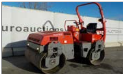
2008 Bomag BW138AD