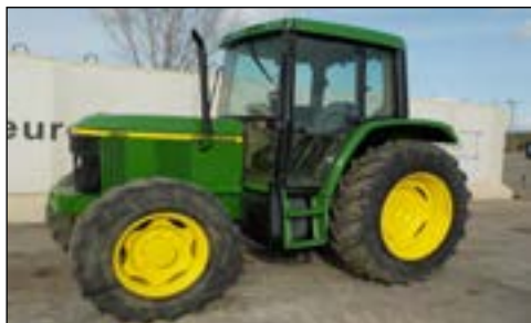
2000 John Deere 6110