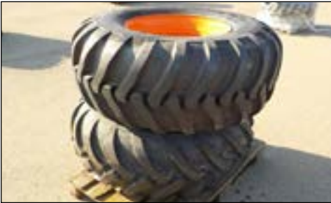
No Usado 500/60-22.5 - Selección