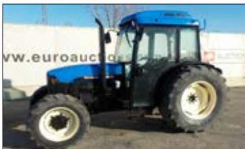
New Holland TN90F