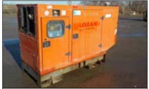
2007 60KvA Skid Mounted Generator