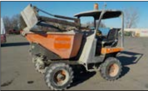
2007 Ausa 250RHGS