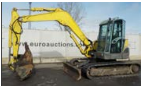
2007 Yanmar SV100