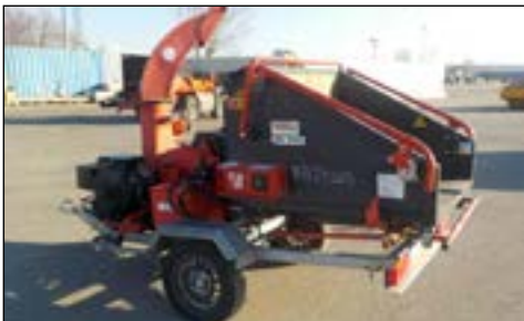
2011 Bugnot BVE55