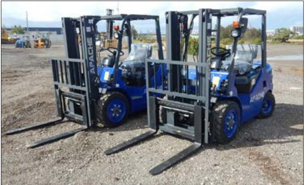
No Usado Apache HH30Z - selección