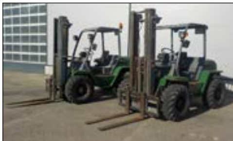
02-03 Agria 30.25 - selección