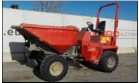
2005 Ausa 350-AHG