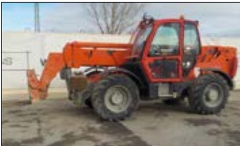
2007 JCB 535-140