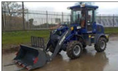
2018 Apache AP218 - selección