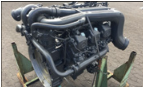
Unbenutzt Mercedes-Benz OM441LA Turbo Diesel