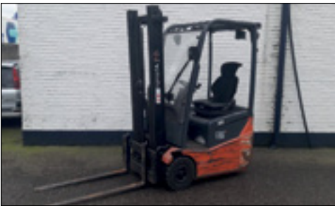
2011 Toyota 7BEST15