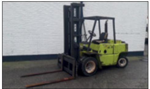
Clark C500 Y80D