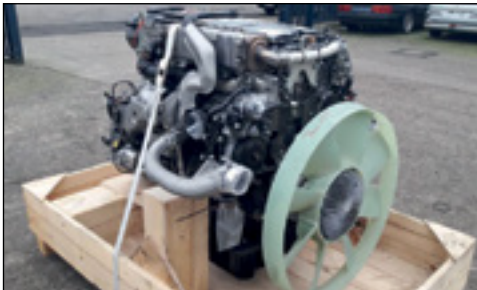
Unbenutzt Mercedes-Benz OM936LA6 Turbo Diesel (Euro 6)