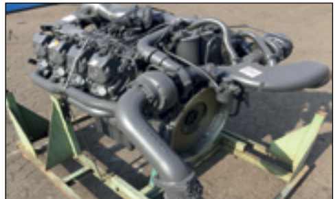
Unbenutzt Mercedes-Benz OM442A Turbo Diesel