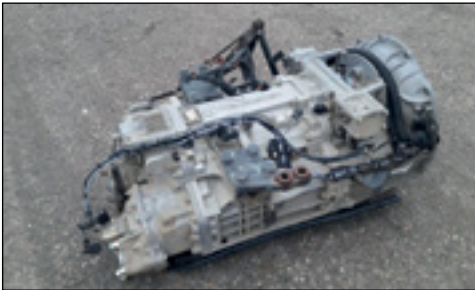
Mercedes-Benz Gearbox to suit Axor - Auswahl