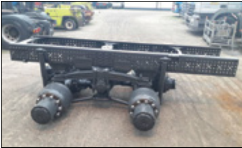
Unbenutzt Boogie Pack Mercedes-Benz Actros MP4 - Auswahl