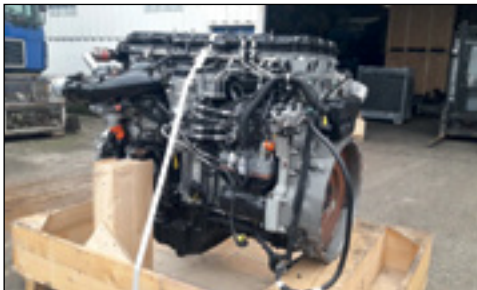
Unbenutzt Mercedes-Benz OM470LA6 Turbo Diesel (Euro 6) - Auswahl