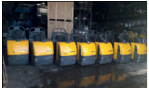
2011 Jungheinrich ECE225 - Auswahl