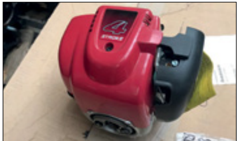
Unbenutzt Honda 4 Stroke Engine - Auswahl