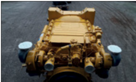
Deutz BF12L513 Twin Turbo V12 Diesel (50 Hours) - Auswahl