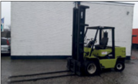
Clark GPX 50S D