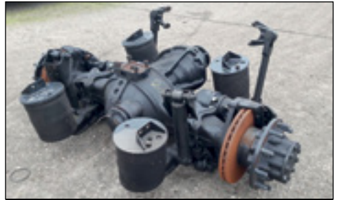
13 Ton MAN Middle Axle to suit TGS,TGA,TGX - Auswahl