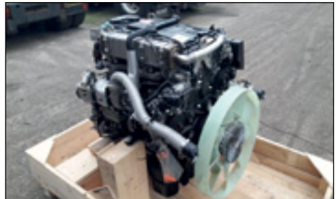
Unbenutzt Mercedes-Benz OM934 Turbo Diesel (Euro 6)