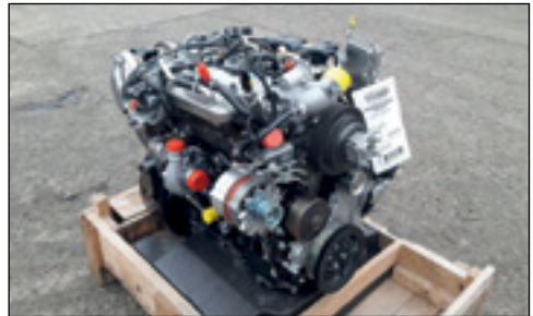
Unbenutzt Perkins / CAT C3.4B Turbo Diesel - Auswahl